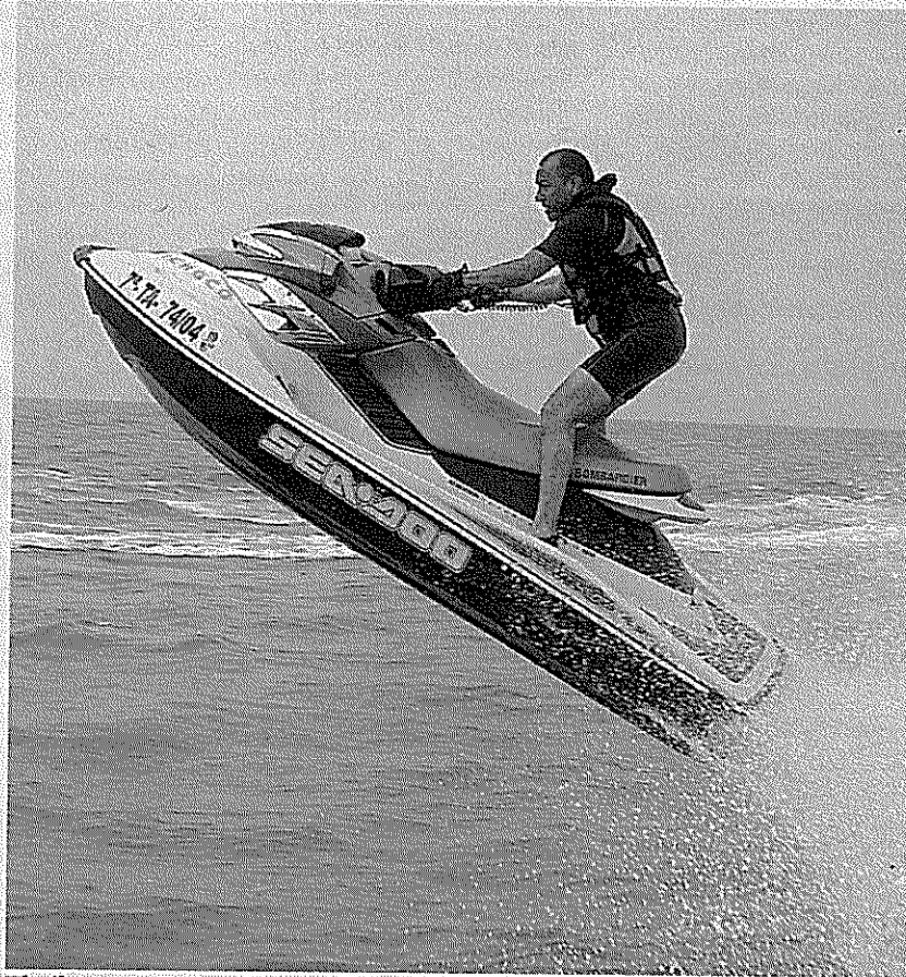
El piloto egarense, ejecutando un salto.

Tomar parte en las dos últimas ediciones del Campeonato de Catalunya ha supuesto todo un reto para él; un reto que ha superado con éxito. "El deporte de las motos náuticas es algo muy vivo. Tiene un atractivo enorme. Hay chavales jóvenes que suben con fuerza". Pese a todo, Quintas está dispuesto a participar este año en el